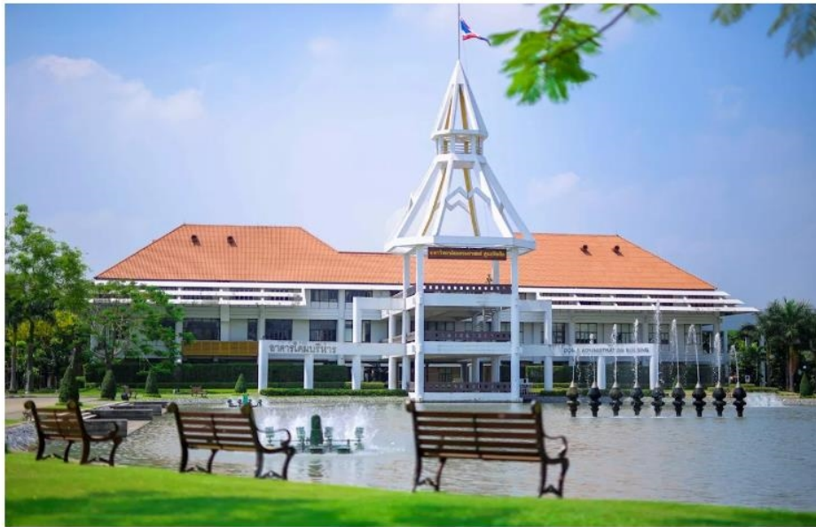
ประเทศไทย ข่าว, ประเทศไทย หัวข้อข่าว

เด็ก มธ. ชวนสร้าง 'ค่านิยมใหม่' วันรับปริญญา ใช้วาระเฉลิมฉลองบัณฑิต เป็นสะพานเชื่อมโอกาสสู่สังคม กดอ่าน